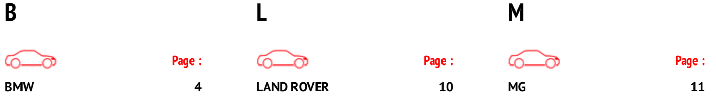
TABLE OF CONTENTS